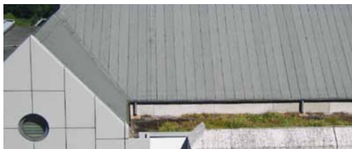
SK Bit 105 ® PV se dá použít i na střeších s velkým sklonem

Elastomerové syntetické komponenty zabezpečují zároveň optimální flexibilitu materiálu při nízkých teplotách.